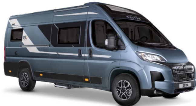
V62 65 ANS